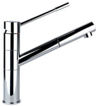
龙头 Lorenzo 8466 000