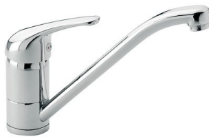
龙头 S1000 - RO 8443 002